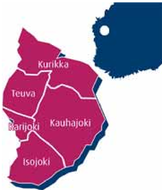
Kuva 1. Yhdistyksen toiminta-alue Leader-ohjelmakaudella 2014-2020.

Toteutamme alueella EU-osarahoitteista Leader-ohjelmaa. Toimintaamme kuuluu niin paikallisen, seudullisen kuin kansainvälisenkin kehittämistoiminnan hankkeistaminen järjestö-, julkisyhteisö- ja yrityspuolella. Yhdistys on eri tavoin osallisena alueen kehittämistoiminnassa vastaten myös alueen kylien ja yhteisöjen kehittämisestä.