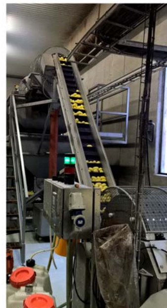
Suupohjan Perunalaakso oy