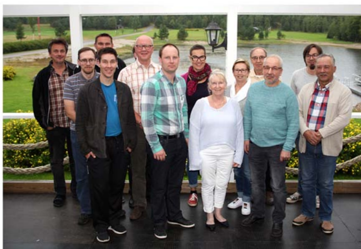
Hallituksen jäsenet Teuvalla 31.8.2017

Hallituksen kokouspäivämäärät loppuvuodelle 2017 ovat 5.10, 2.11 ja 14.12.